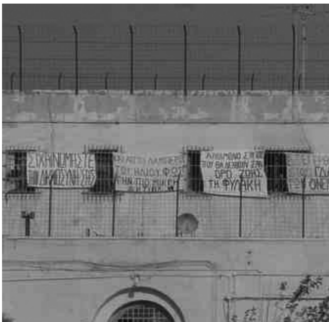
Πανό από την εξέγερση στις φυλακές Αλικαρνασσού.